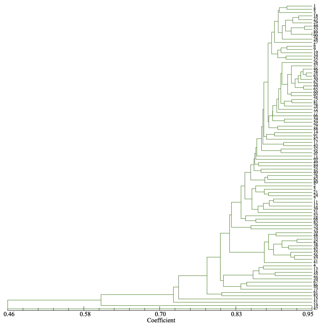
图2 依据UPGMA法构建的准噶尔山楂92个个体的聚类图 Fig. 2 Clustering dendrogram of 92 Crataegus songorica individuals based on UPGMA