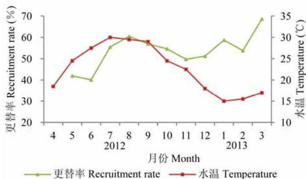
图2 同安湾鱼类种类的月更替率